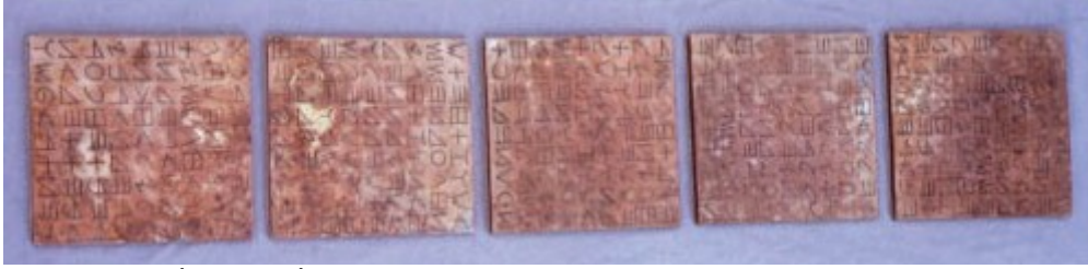
Faïence engobée, enfumée. 78 x 115