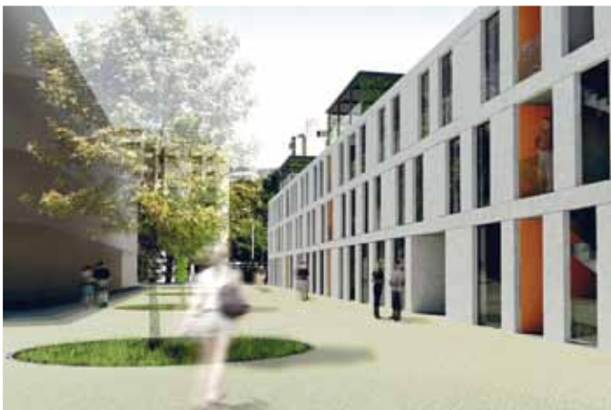
Projet de Christophe Aebi

Le territoire de la Ville de Carouge entre dans une période de transformations liée à de grands projets cantonaux. La Haute Ecole du paysage, d'ingénierie et d'architecture de Genève (hepia) s'est intéressée au développement du périmètre nommé «Carouge-Est» et l'a choisi pour la diversité des thèmes qu'il offrait aux diplômants du bachelor en architecture.