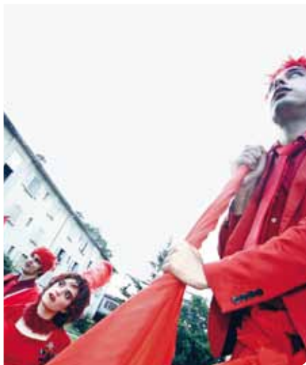
Du théâtre à toutes les hauteurs... Zanco et sa parade rouge

Le 26 juin, la Fête de quartier a été la première étape visible du projet conduit par Zanco. Après des mois de préparation et six rencontres troc, le préau de l'école du Val d'Arve a vibré avec un programme riche du matin au soir. Buffet canadien et musique DJ, démonstration de tai-chi, hip-hop, reggae et capoeira, fabrication de pompons à la chaîne et enclos de rongeurs, nombreux sont ceux qui ont pu profiter des activités proposées par les habitants. Merci à toutes et à tous! ■