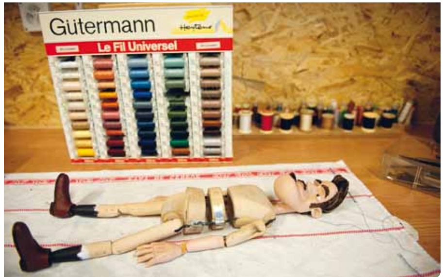
Une marionnette de la ZoT Compagnie en cours de fabrication

325 000 francs pour la démolition partielle des bâtiments, selon le devis estimatif partiel établi par le bureau d'architectes, et un crédit de 185 000 francs pour des travaux d'aménagements intérieurs et de mise en conformité des bâtiments conservés.