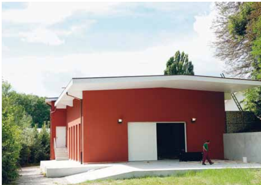
L'arrière du complexe et sa salle polyvalente

trois parties : devis général initial, demandes complémentaires du maître d'ouvrage intervenues après la votation du crédit et coûts des travaux non prévus ou découlant des découvertes pendant le chantier. Le montant du crédit complémentaire demandé se monte à 2 600 000 francs (sur la base de 85 % de prix confirmés et de travaux exécutés par les entreprises déjà mandatées pour ce chantier). Le Conseil municipal décide de renvoyer ce projet en commission plénière, afin de pouvoir se prononcer en toute connaissance de cause, et demande accessoirement d'évaluer la somme qui serait économisée en cas de renoncement à l'aménagement de l'appartement du concierge.