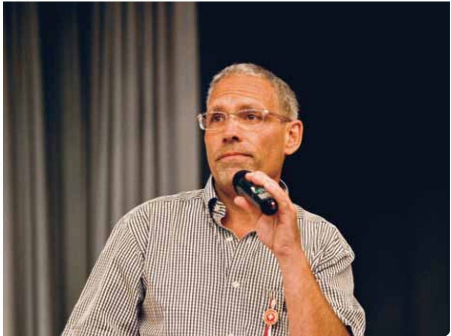
Marc Nobs, maire de Carouge

Nous devons faire preuve de plus d'audace, d'ambition positive, nous devons, tous ensemble, soutenir des projets futuristes d'envergure pour remettre aux générations futures des conditions de vie alliant toutes les valeurs fondamentales que j'évoquais, il y a un instant.