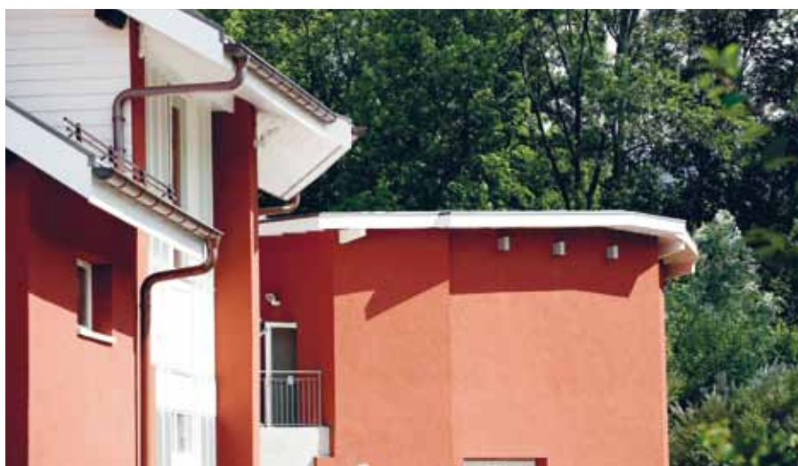
Les bâtiments de Grange-Collomb

«Un projet mal étudié qu'il a fallu remettre sur les rails et mener à bien, malgré son coût»