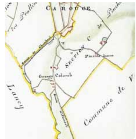
Grange-Collomb est ses confins, selon le plan d'assemblage du cadastre de 1812