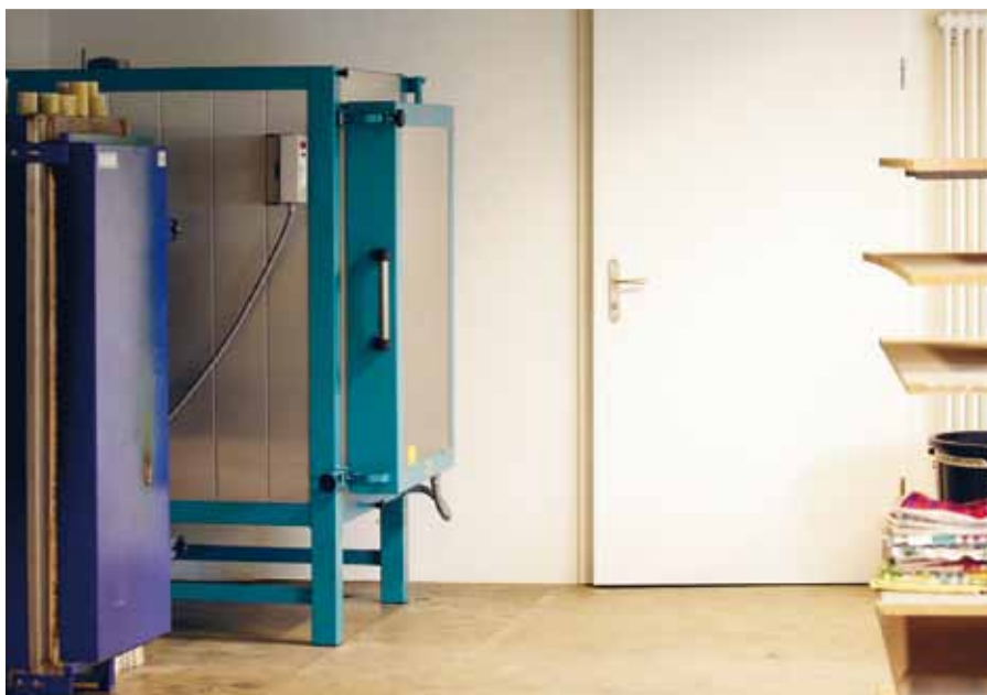
Les ateliers de la Fondation Bruckner

Le coût de la construction est estimé par le bureau CREAD à environ 395 francs le m 3 pour une estimation du futur volume construit de 5000 m 3 , soit un coût total des travaux se montant à environ 1 969 000 francs. Le Service immobilier accepte cette estimation, compte tenu des informations dont il dispose, qui se base sur une volonté commune de tous les intervenants de construire une «boîte aménagée très simplement». La somme de 2 100 000 francs est dès lors inscrite, dès 2004, dans le plan des investissements par le Service immobilier.