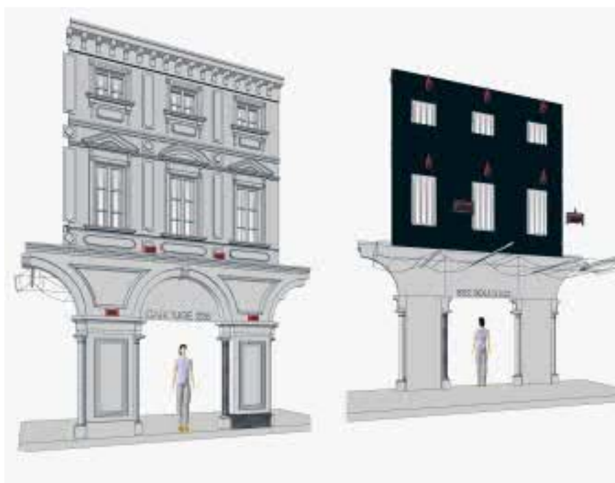
Maquette du décor de la réplique de la place San Carlo de Turin

Afin de rappeler l'appartenance de Carouge au royaume de Piémont-Sardaigne, il semblait logique de convier à cette fête certaines villes de l'ancien royaume. Le comité d'organisation a donc souhaité inviter Chambéry, siège de la maison de Savoie jusqu'en 1562, la ville de Turin, lieu de résidence des ducs de Savoie, des princes de Piémont et des rois de Sardaigne jusqu'à la création du royaume d'Italie, ainsi que la ville de Nice, dont la dédition à la maison de Savoie date de 1388 déjà.