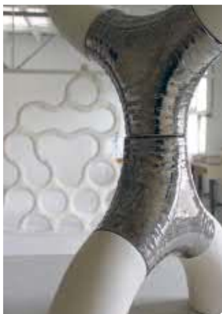
Œuvre de Drazen Vitolic

Depuis près de vingt-cinq ans, le Parcours Céramique Carougeois présente, en parallèle au Concours international de céramique du Musée de Carouge, plus de 20 expositions à Carouge et à Genève ainsi qu'une série d'événements qui en font un véritable festival de la céramique. Depuis 2010, cette biennale internationale est organisée par la Fondation Bruckner pour la promotion de la céramique.