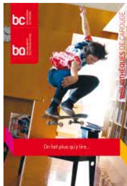
Plaquette de présentation des bibliothèques

Ces nouveaux éléments ont pour but de clarifier toute l'offre proposée par la Bibliothèque et la BiblioQuartier et de vous aider à trouver plus rapidement l'information que vous cherchez. ■