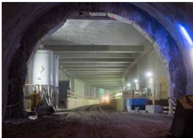
Le tunnel de Champel, depuis le front Val d'Arve, débouche maintenant sur la halte de Champel-Hôpital suite à la démolition de la paroi moulée.