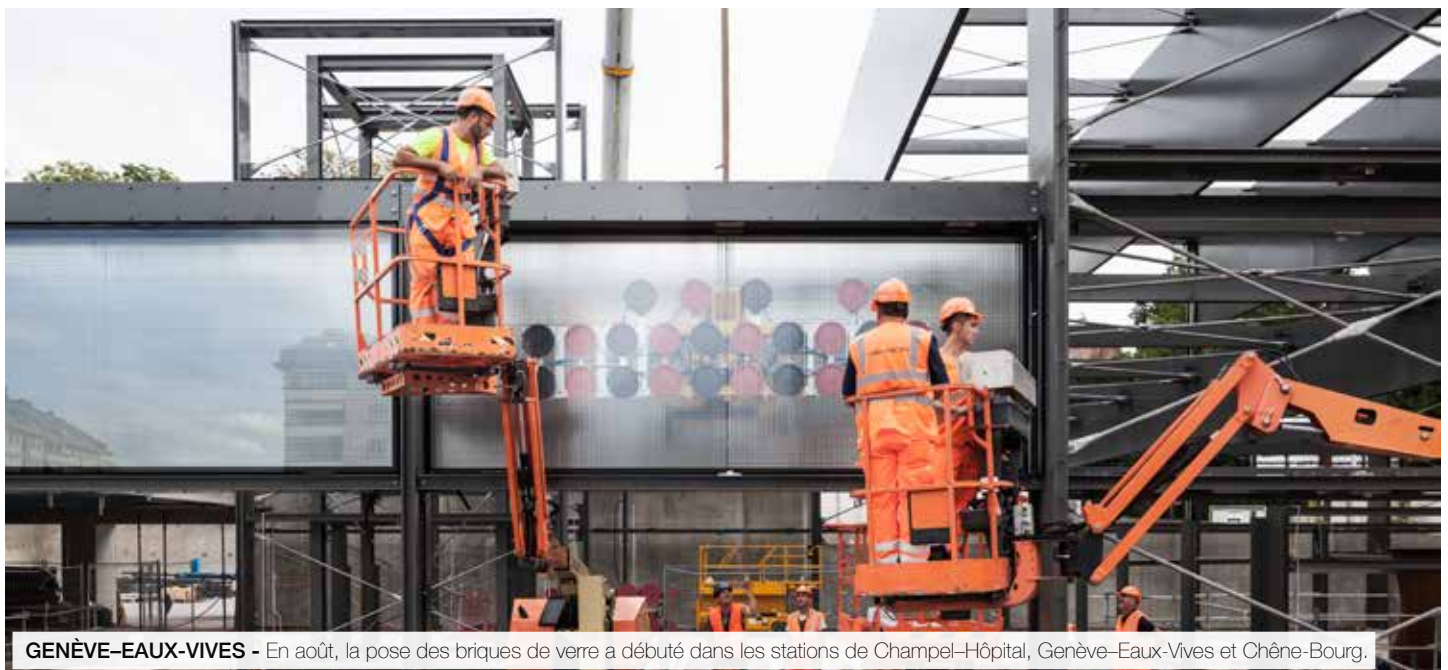
GENÈVE-EAUX-VIVES - En août, la pose des briques de verre a débuté dans les stations de Champel-Hôpital, Genève-Eaux-Vives et Chêne-Bourg.