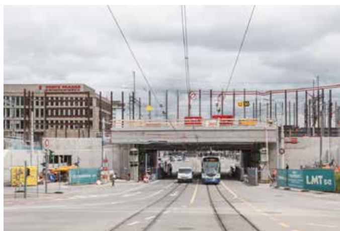
Gare de Lancy - Pont-Rouge : Le pont ferroviaire a été abaissé d'un mètre au-dessus de la route du Grand-Lancy et des voies du tram.