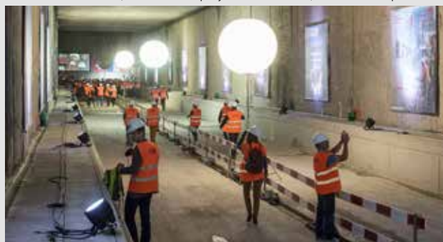
Une exposition sur l'histoire du projet était visible en sous-sol.