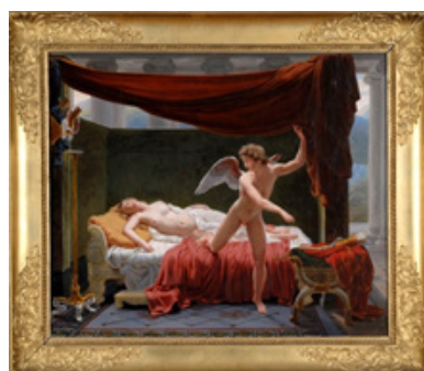
François-Edouard Picot L'Amour et Psyché