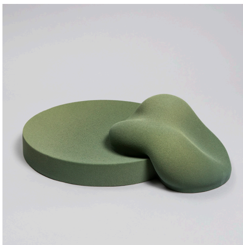
Atelier Baptiste et Jaïna, Lichen , faïence chamottée coulée, prototype sculpté, engobe et couverte transparente mate par projection. Cuisson électrique à 1000° puis deux autres à 980°. Longueur 50 cm ; largeur 38.5 cm ; hauteur 9 cm

Le Prix de la Ville de Carouge est aussi attribué à l'atelier Baptiste et Jaïna (F) pour leur céramique intitulée « Lichen ». Le jury a particulièrement apprécié la rencontre entre la sérénité et la force qui cohabitent dans cette pièce. Les auteurs proposent une esthétique, une fluidité et un revêtement poudré qui ont séduit les membres du jury.