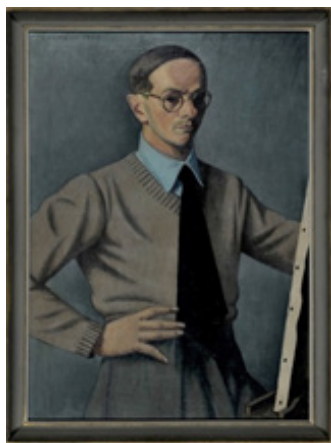
Émile Chambon Autoportrait à la cravate

1952 Huile sur toile Donation Émile Chambon au Musée de Carouge